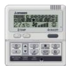
RC-E5 / RC-EH5 (Chaud seul)