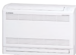
SRF25ZS-W SRF35ZS-W SRF50ZSX-W