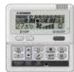
RC-E5 RC-EH5 (Chaud seul)