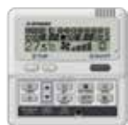
RC-E5 / RC-EH5 (Chaud seul)