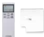
Contrôle infrarouge RCN-TC-5AW-E2