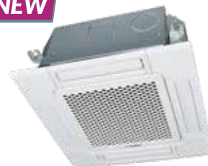
Façade STANDARD TC-PSA-5AW-E