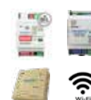
MH-RC-BAC-1 MH-RC-KNX-1I MH-RC-MBS-1 MH-RC-WIFI-1