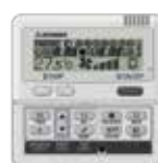
RC-E5 RC-EH5 (Chaud seul)